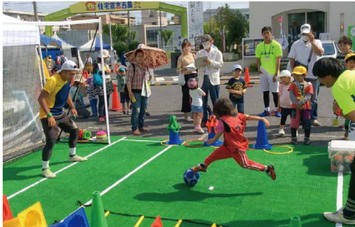
▼ 広島テレビ 住宅展示場 住宅宣言吉島

イベントにはおよそ1,000人以上の方が来場され、大賑わい。ブースにもたくさんの親子が訪れ、サッカーを楽しんで頂きました。体験を通じてもっとスポーツをしてみたい！と思ってもらえるように、PKシュートなど、誰でもチャレンジしやすい企画を用意しました。