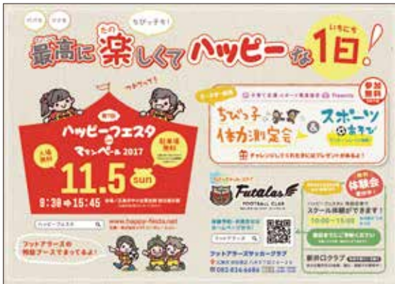
▲参加者募集チラシ