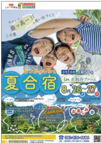
参加者募集チラシ