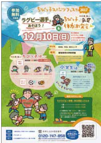
◀ 参加者募集チラシ