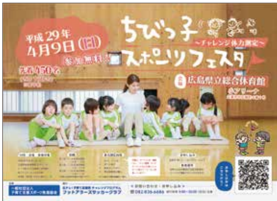
▲参加者募集チラシ