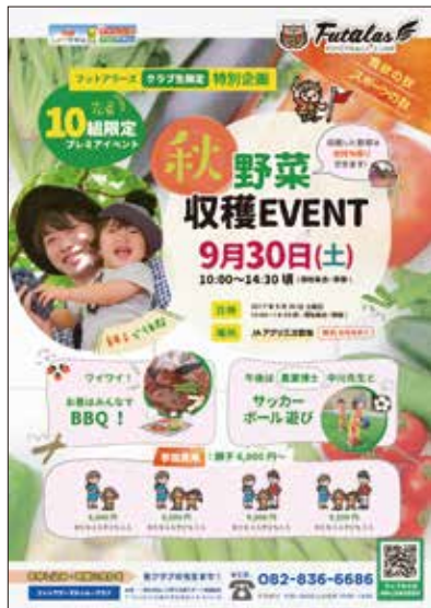
参加者募集チラシ